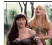
The Not So Subtle Subtext