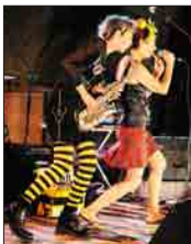
Belladonna 9 ch

Si elles étaient un film, ce serait La Strada . À moins que ce ne soit Talons Aiguilles . Une ville ? Berlin, Barcelone ou Marseille. Un mythe ? Celui des Amazones... Les cigales de la crise mondiale nous entraînent sur leur planète balkan kumbia électro guinguette rock vodka & fraise tagada !