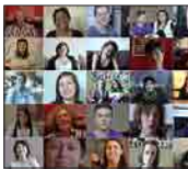
« Je suis lesbienne » Montréal

« Je suis lesbienne », voilà ce qu'affirment les vingt-deux montréalaises de ce documentaire. Derrière cette phrase, des vécus, des expériences, des regards diversifiés et singuliers sont livrés en toute liberté. La parole est au centre de ce film, elle le constitue. Elle donne à entendre des voix méconnues, ignorées et souvent trop peu écoutées. Cette parole est ici témoignage, mais avant tout, prise de pouvoir.